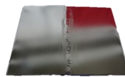
溶接したステンレス鋼の耐食性評価の例